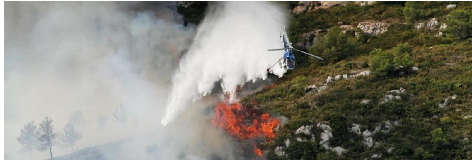
DEFENSE ET PROMOTION DU SECTEUR HÉLICOPTÈRE

L'hélicoptère, de par sa nature lui permettant d'effectuer des décollages verticaux, est indispensable pour de nombreuses missions. Cette machine a pour avantages de se déplacer dans des endroits difficilement accessibles et de faire des interventions rapides. Ainsi, il assure un travail essentiel pour le quotidien de la population.