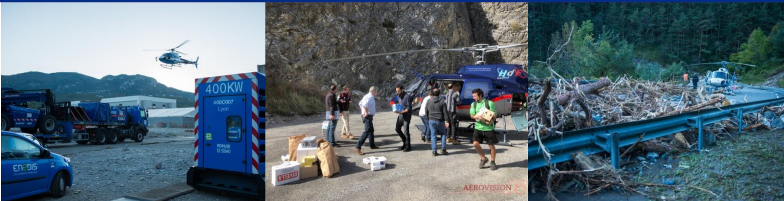
Tempête Alex - Les hélicoptères de RTE et Hélicoptère de France en soutien

DEFENSE ET PROMOTION DU SECTEUR HÉLIPTÈRE