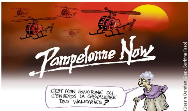
(Dessin Damien Glez - Burkina Faso)